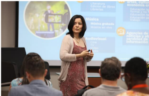
Silvia Constaín - Ministra de las Mincit – Modernización del Sector