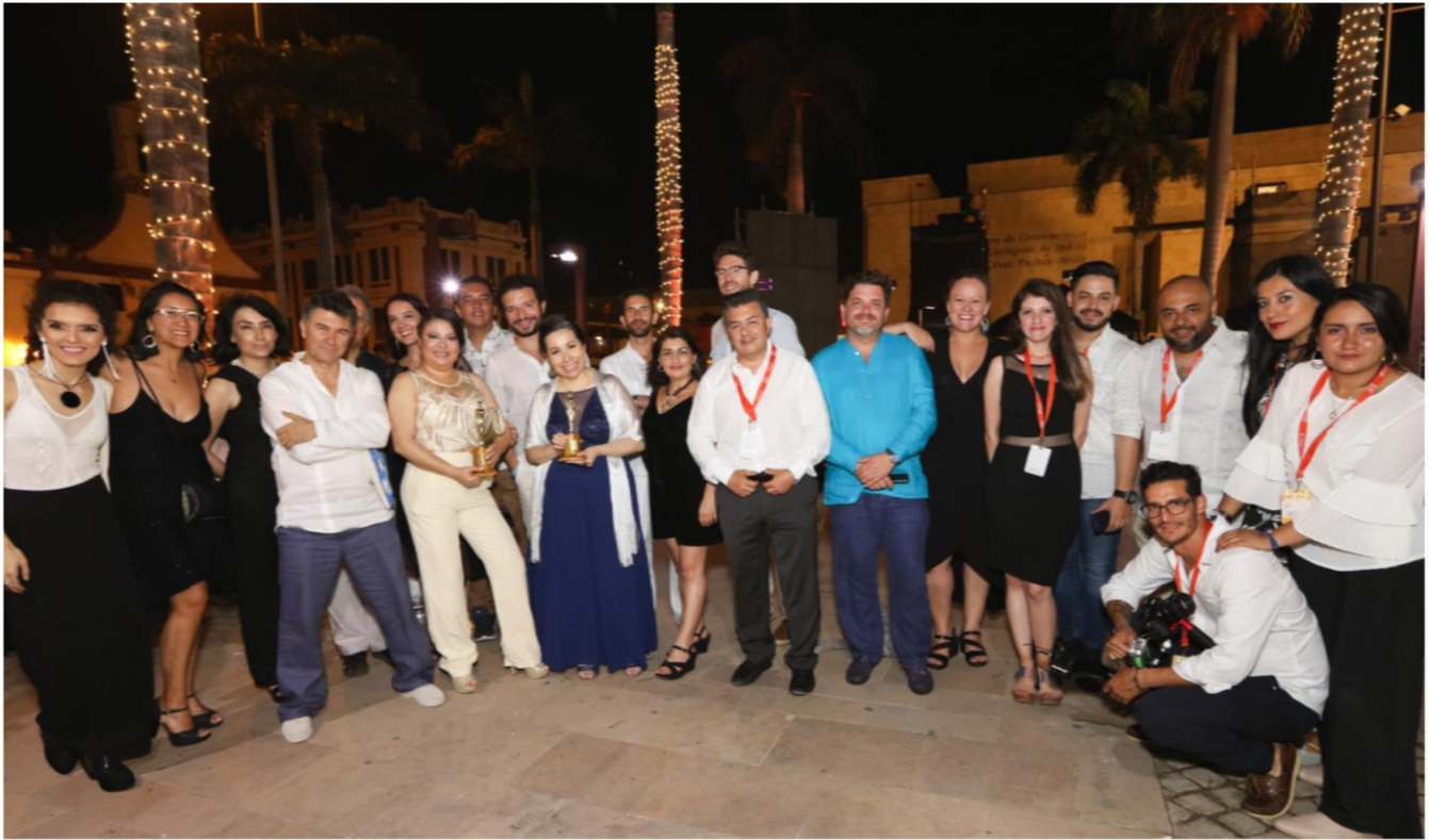
Equipo RTVC en los India Catalina.