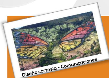
Diseño cortesía - Comunicaciones

#SeSupoQue el próximo 15 de marzo, se llevará a cabo la iniciativa de la Alcaldía Mayor de Bogotá, que busca beneficiar 14.989 habitantes de los 7 barrios de la mariposa.