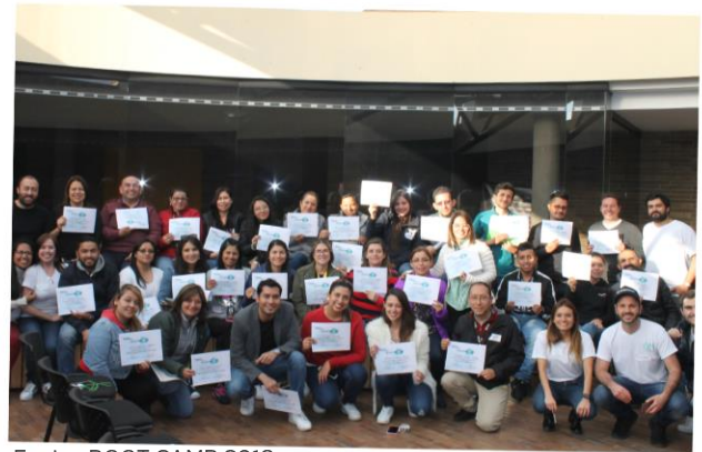
Equipo BOOT CAMP 2019

El pasado 8 de marzo en las instalaciones de la Universidad Militar de Cajicá, se llevó a cabo el primer BOOT CAMP, una iniciativa de la coordinación de planeación y RTVC para todos los colaboradores de la entidad. El objetivo principal fue promover la creatividad con nuevas propuestas que mejorarán procesos e implementarán nuevas iniciativas basadas en innovación.