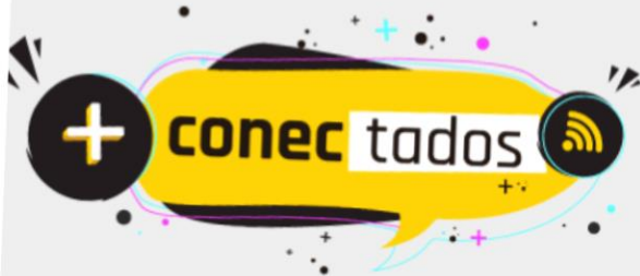
Diseño cortesía - Coordinación de TI

Recuerda seguir las instrucciones del manual "funcionarios, Colaboradores e Invitados" que anteriormente fue socializado por medio de un all user , con los pasos a seguir. Si tienes cualquier dificultad, el área de TI estará dispuesta a solucionar los problemas que surjan a la hora de conectarte a las nuevas redes de nuestra entidad.