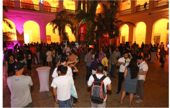
Evento OYE MI SOCIO