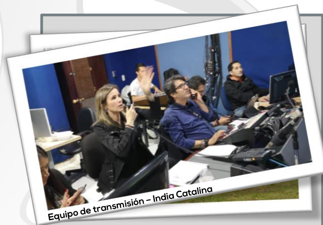
Equipo de transmisión - India Catalina