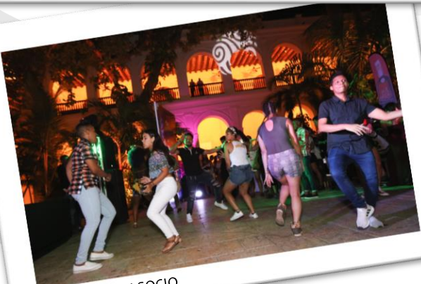
Evento OYE MI SOCIO